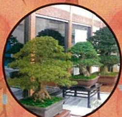
秋季さつき展・参道植木市